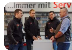
Betriebliche Lernphasen (Praktika)