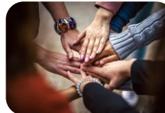
Training sozialer Kompetenzen