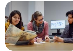
Vorbereitung auf die Berufsschule