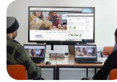
Vermittlung digitaler Kompetenzen