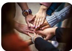
Training sozialer Kompetenzen