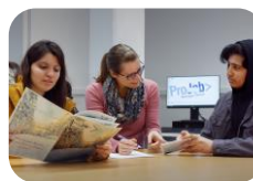
Vorbereitung auf die Berufsschule