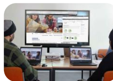
Vermittlung digitaler Kompetenzen