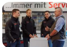
Betriebliche Lernphasen (Praktika)